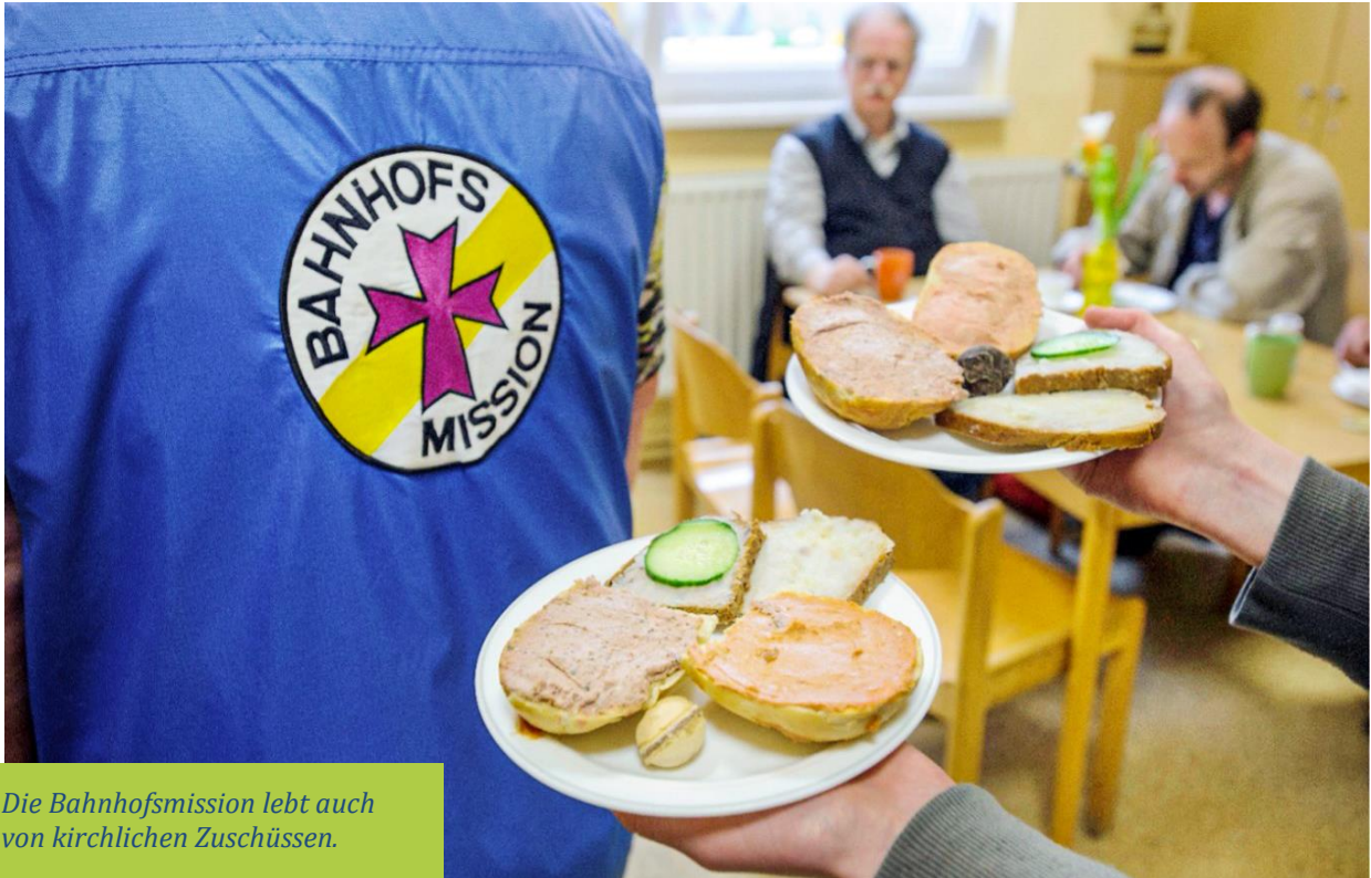
Die Bahnhofsmision lebt auch von kirchlichen Zuschüssen.

Der kirchliche Finanzierungsanteil an diakonischen Aufgaben schwankt. Doch ohne ihn müsste Vieles aufgegeben werden.