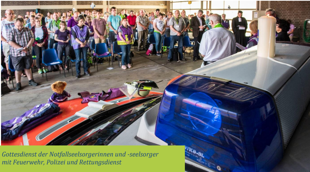
Gottesdienst der Notfallseelsorgerinnen und -seelsorger mit Feuerwehr, Polizei und Rettungsdienst

Der Artikel 137 der Weimarer Reichsverfassung von 1919 legt fest, dass es keine Staatskirche gibt. Den Kirchen wird das Recht eingeräumt, ihre Angelegenheiten selbst zu ordnen. Die sogenannten Kirchenartikel der Weimarer Reichsverfassung (136–139, 140) sind durch den Artikel 140 des Grundgesetzes in die Verfassung aufgenommen und werden als nähere Ausführungen zu Artikel 4 des Grundgesetzes betrachtet, der die Religionsfreiheit garantiert.