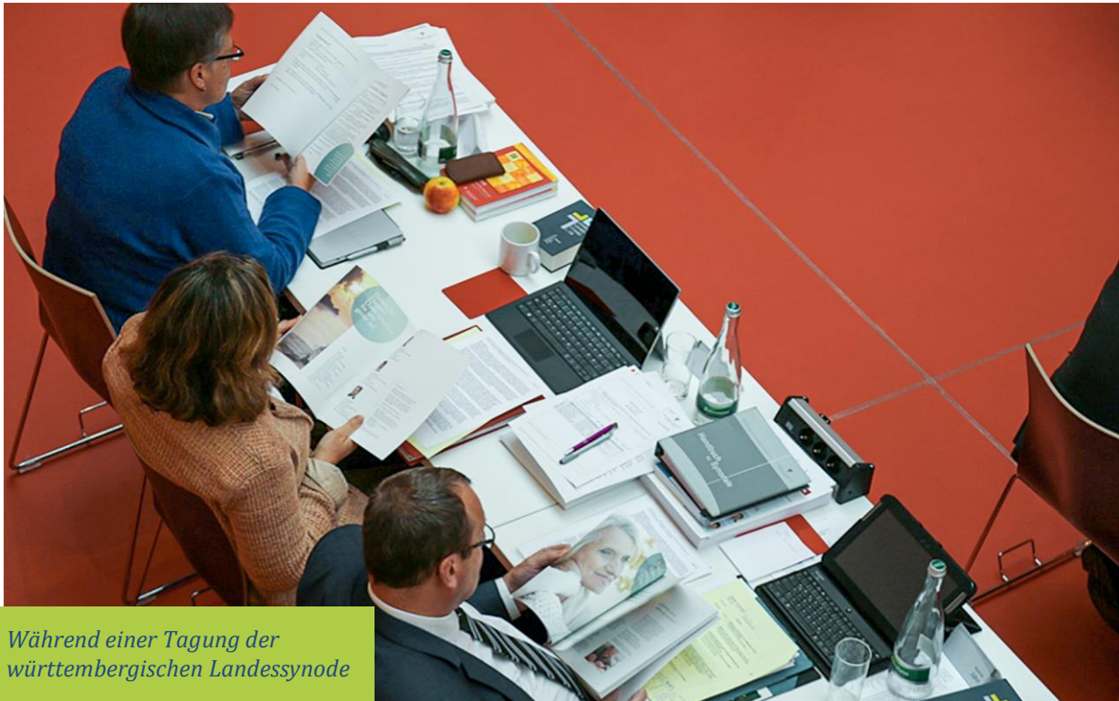
Während einer Tagung der württembergischen Landessynode

Gewählte Vertreterinnen und Vertreter entscheiden öffentlich über die Verwendung der Gelder.