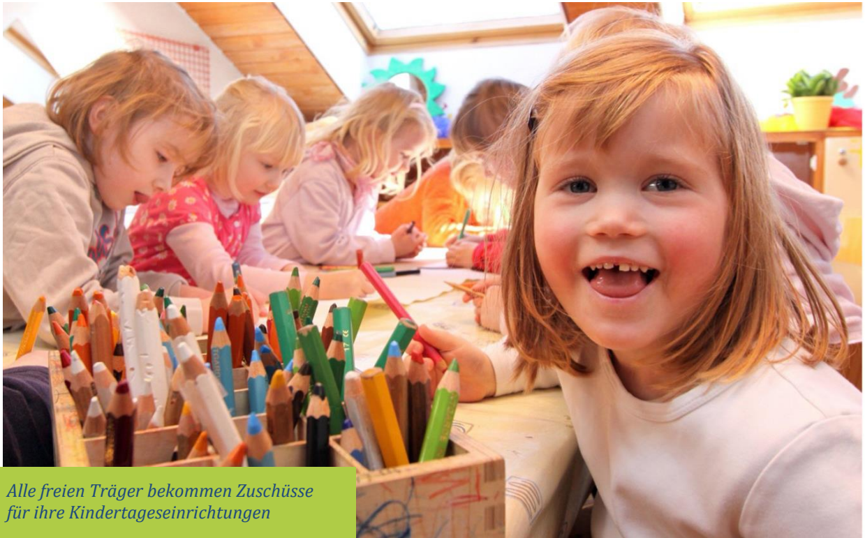
Alle freien Träger bekommen Zuschüsse für ihre Kindertageseinrichtungen

Richtig ist, dass der Staat alle freien Träger bezuschusst, die soziale Einrichtungen betreiben.