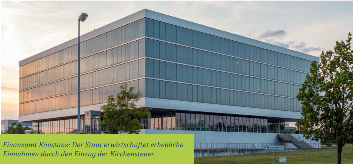
Finanzamt Konstanz: Der Staat erwirtschaftet erhebliche Einnahmen durch den Einzug der Kirchensteuer.

Das stimmt. Und beide profitieren davon.