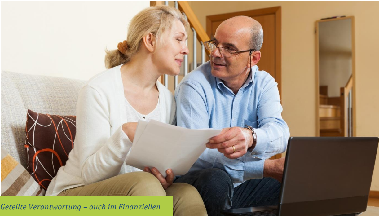
Geteilte Verantwortung – auch im Finanziellen

Zu Ihrem gemeinsamen Lebensführungsaufwand gehört auch Ihr Beitrag zur Kirche.