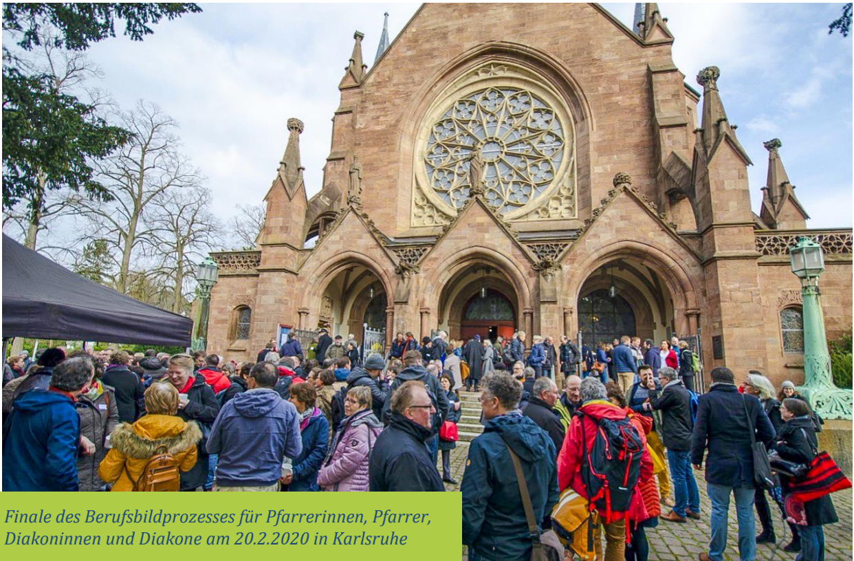
Finale des Berufsbildprozesses für Pfarrerinnen, Pfarrer, Diakoninnen und Diakone am 20.2.2020 in Karlsruhe

Wir finden, die Arbeit von Pfarrerinnen und Pfarrern, Diakoninnen und Diakonen ist weit mehr als Bürokratie.