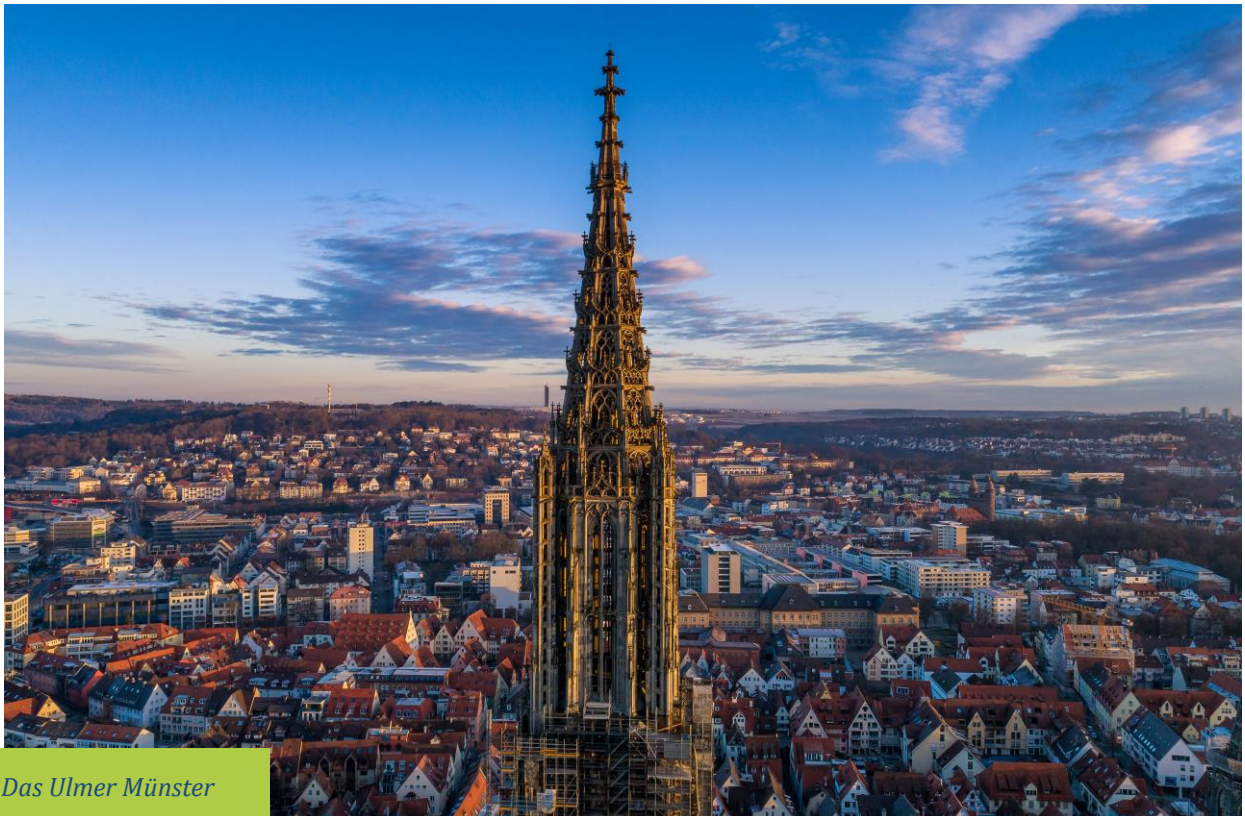
Das Ulmer Münster

Das stimmt. Aber verkaufen Sie mal das Ulmer Münster!