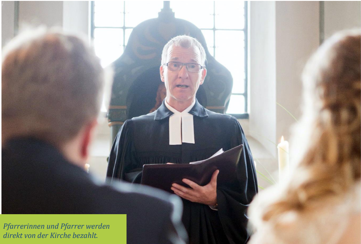
Pfarrerinnen und Pfarrer werden direkt von der Kirche bezahlt.

Das ist in Baden-Württemberg nicht der Fall.